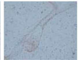
ラット 毛包 パラフィン切片

保存方法 1ヶ月程度の保存の場合は、2~8°Cで保存可能です。長期保存の場合は、抗体を小分けした上で、-20°C 以下での保存をお勧めします。また、凍結融解を繰り返すと、抗体が劣化し、本来の性能が得られない場合があるため、お避けください。