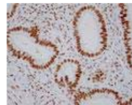
ヒト 子宮 パラフィン切片