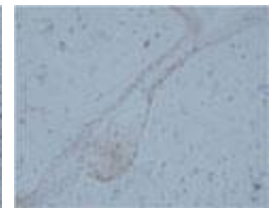
ラット 毛包 パラフィン切片

保存方法 1ヶ月程度の保存の場合は、2~8°Cで保存可能です。長期保存の場合は、抗体を小分けした上で、-20°C以下での保存をお勧めします。また、凍結融解を繰り返すと、抗体が劣化し、本来の性能が得られない場合があるため、お避けください。