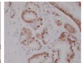
ヒト 前立腺 パラフィン切片

保存方法 1ヶ月程度の保存の場合は、2~8°Cで保存可能です。長期保存の場合は、抗体を小分けした上で、-20°C以下での保存をお勧めします。また、凍結融解を繰り返すと、抗体が劣化し、本来の性能が得られない場合があるため、お避けください。